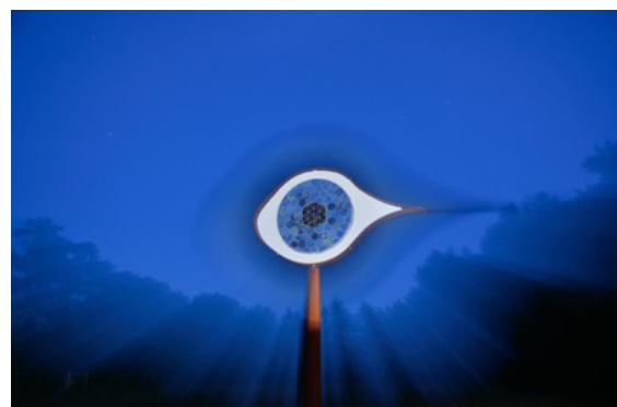
Het OOG ('Eye in the sky')

17 juni 2013 - Het 2e Lustrum van de NME-projectweken van de Maranathaschool werd afgesloten met een expositie van diverse nieuwe kunstwerken in het Curringherveld. Enkele daarvan zullen gedurende vele jaren aanwezig blijven als een karakteristiek in het terrein t.w. 'Het Oog' dat werd samengesteld uit tientallen keramiek-werkstukken van alle leerlingen van de basisschool en het spiraalvormige (in- en uitrollende) Labyrint, gelegen tegenover de Kleine Beestjestuin. Als u erin naar binnen gaat passeert u een fotogalerij van 10 jaar schoolprojecten. Het labyrint werd ontworpen door Jeltje Kloppenburg.