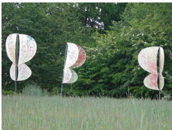
En hun 'ecologische voetafdruk' in het Curringherveld: