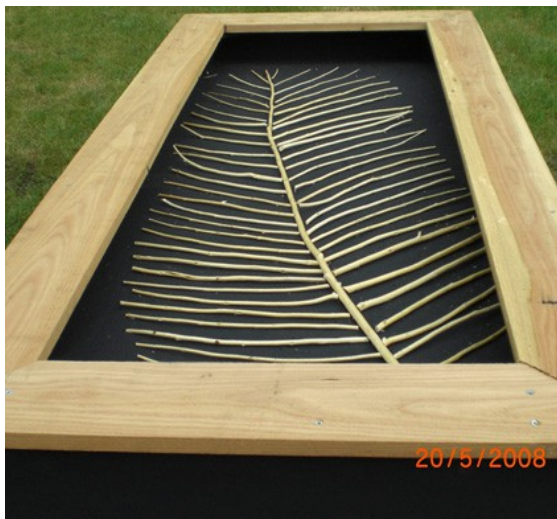
De Kraai moest een veer laten.. hieronder de 'opgeveerde' Kraai: