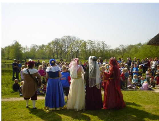
De Canon: "Hemel en aarde kunnen vergaan... Vrolijke musici, vrolijke musici, vrolijke musici... blijven bestaan"!

Woensdag 18 maart 2009 ging de NME-werkgroep met de Maranathaschool naar de Beurs van Berlage in Amsterdam voor de finale van de Nationale Onderwijsprijs, namens de provincie Groningen, met het prachtige (lustrum) schoolproject 2008 in het