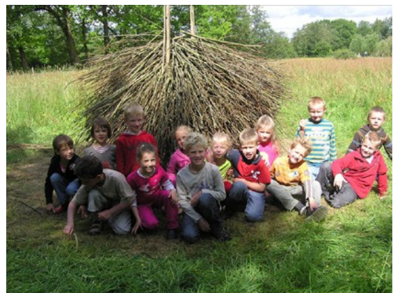
De Vossen van Groep 3 hebben de stekels flink opgezet; de Egel: