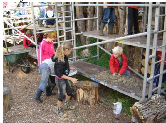
De 'bovenbouw' betreft haar stellingen, letterlijk en figuurlijk....!