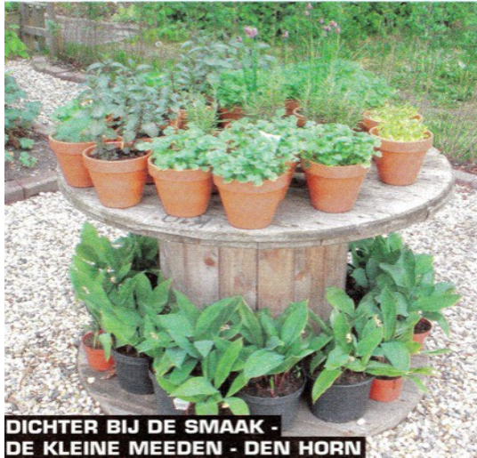
DICHTER BIJ DE SMAAK - DE KLEINE MEEDEN - DEN HORN

melkveehouderij en Waddengoud-producten (Joke Luinstra, weblink De Twee Stromen ) tot de pas geslingerde honing (Henk en Pilly Wierenga). Er was een jamproeverij van biologische vruchten van eigen teelt (Rinie Eimers, weblink Rinie's Winkeltje ) en een vleesproeverij van Schotse Hooglanders (weblink Schotse Hooglanders ) en last but not least een auto met tuinplanten (Appie Wijma). Iedereen kwam 'dichter bij de smaak' in het Curringherveld!