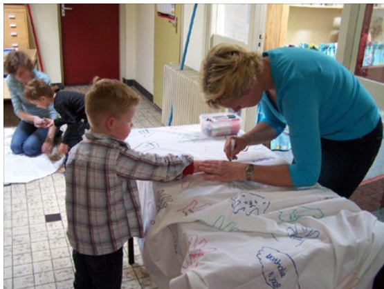
Met handen en voeten je sporen verdienen: