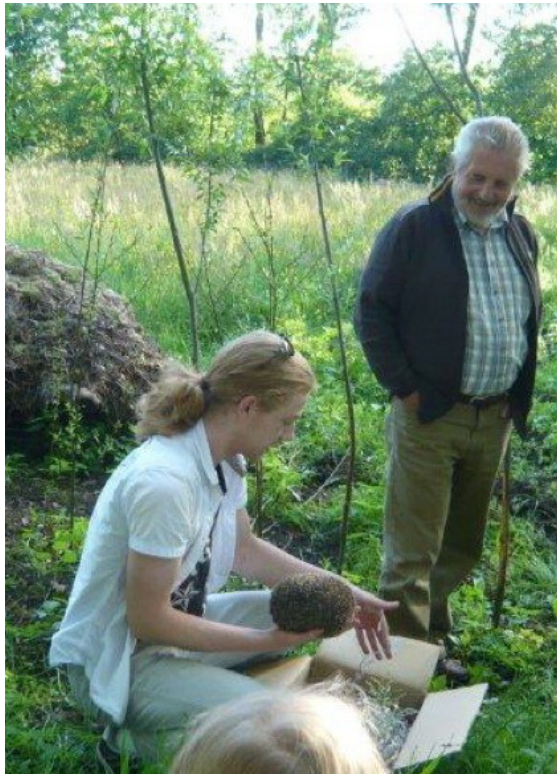
Na een verblijf op het opvangcentrum Fugelhelling weer terug in de natuur..