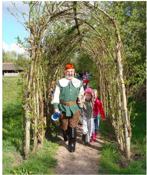
In het Curringherveld in de voetsporen van meester v/d Heide: