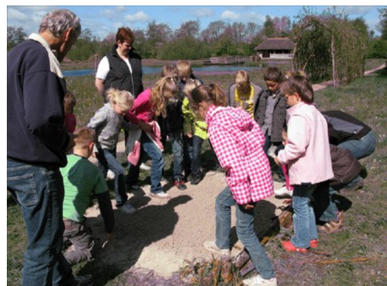
De kinderen zetten hun ecologische footprint: