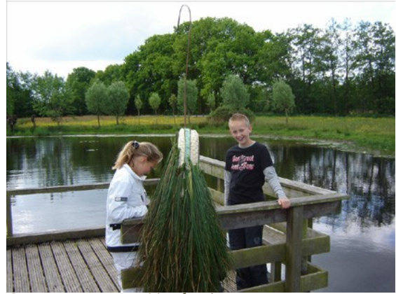
Groep 7 en 8: een Kikker heeft geen veren; een opkikker voor de Reiger: