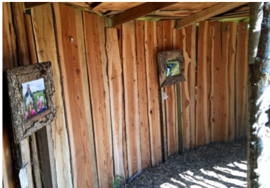
Links project 2012; rechts 2011 Muziek uit de natuur