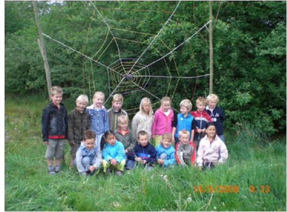
Groep 2 als de Spin in de website Curringherveld: