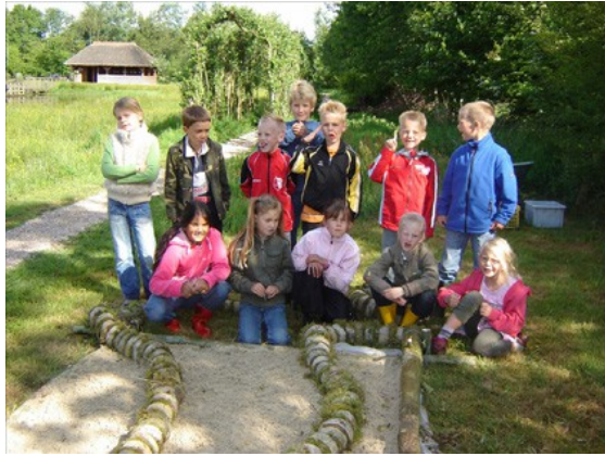
Groep 4 bij hun langdradige 'eindeloze' kunstwerk: de Worm!