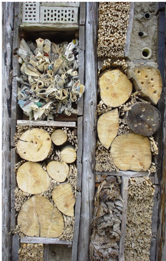
Het exclusieve NME 'arrangement' voor kriebelbeestjes...: