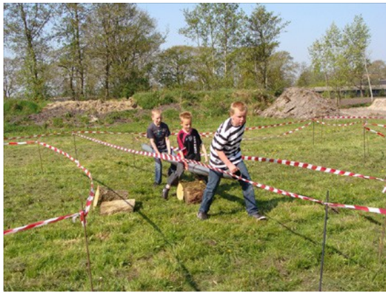
In het buizenparcours kun je eenvoudig het spoor kwijtraken: