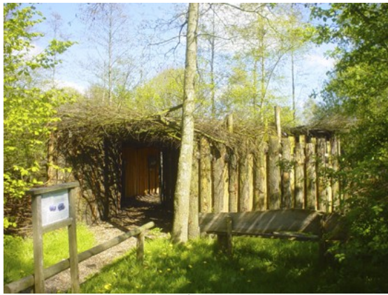
Het LABYRINTH - Fotogalerie 10 jaar NME-projecten