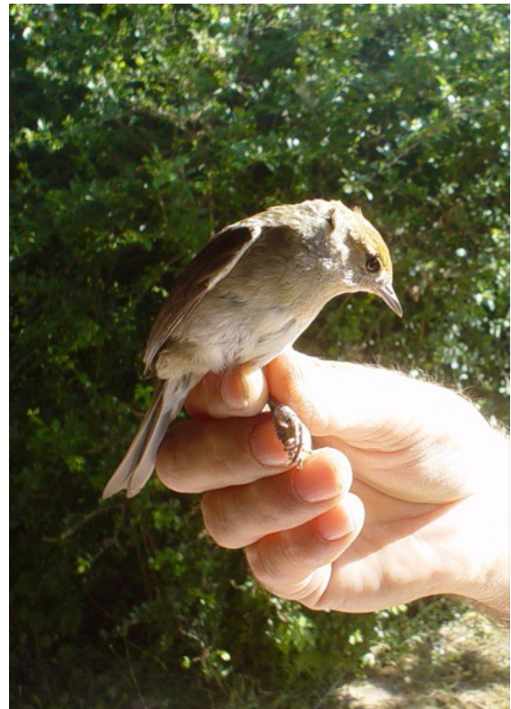
Een 'bastaard nachtegaal' ofwel (vr.) Zwartkop Sylvia-zanger, zojuist geringd.