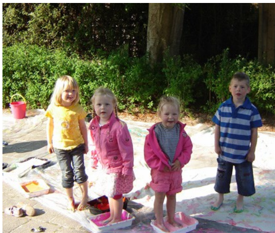
Groep 0 en 1 'op de vleugels van de Vlinder':