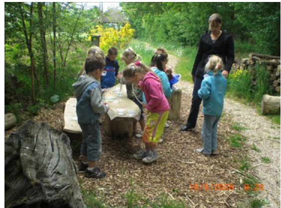
En groep 2 in de mooi aangelegde 'vernieuwde' Kleine Beeststuint: